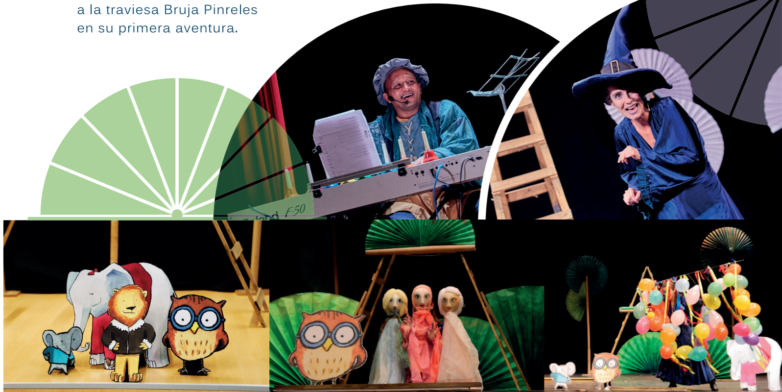
La Bruja Pinreles lleva más de 50 funciones por Castilla La Mancha

Estamos seguros que el impacto de la obra será mayor con los niños y niñas que hayan conocido a la traviesa Bruja Pinreles en su primera aventura.